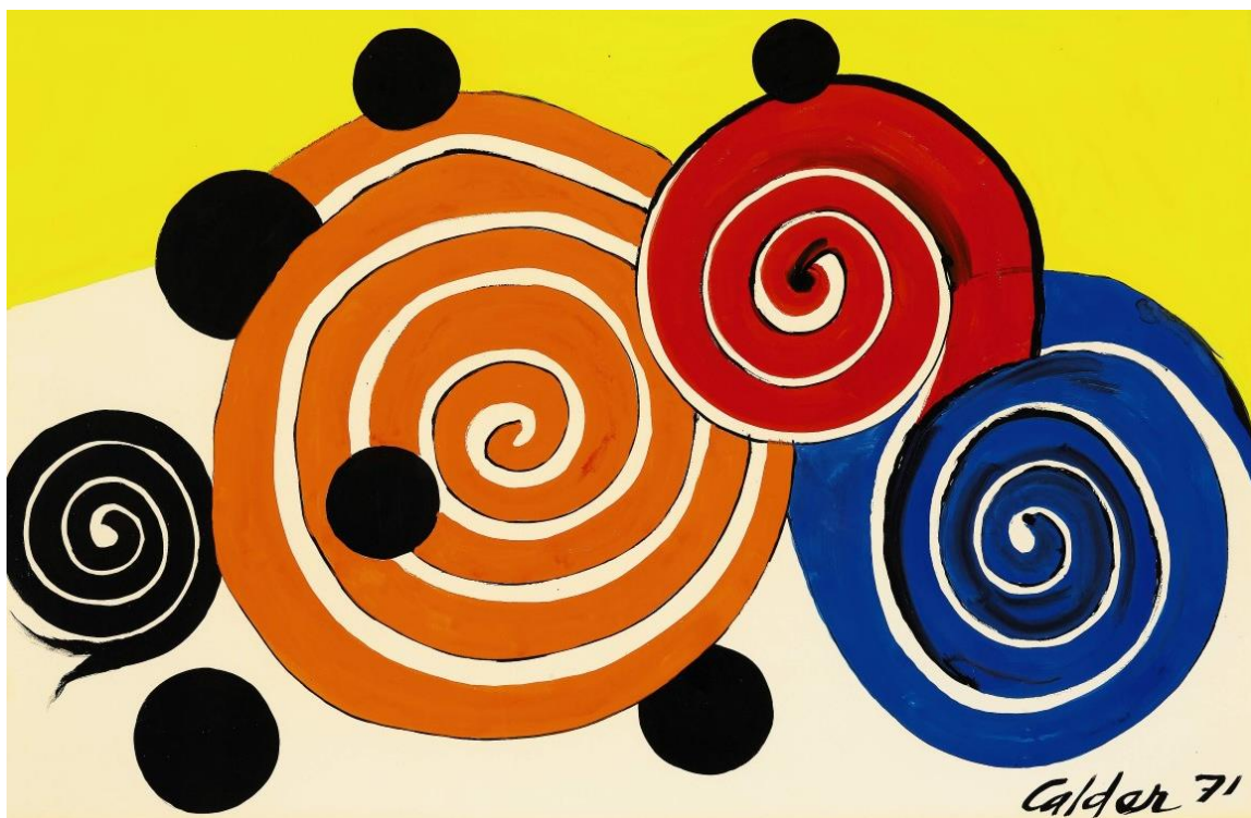
《四個螺旋與六個點》，1971 年，水粉、墨紙本，74.9 x 109.9 公分

「宇宙是真實的，然而你看不到它，只能去想像。 一旦你可以想像，才能考慮複製它。」