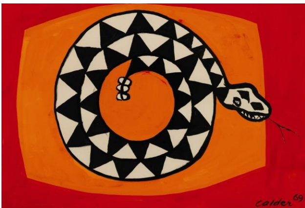
《橘色中的響尾蛇》 1969 年 水粉、墨紙本 74.9 x 109.5 公分