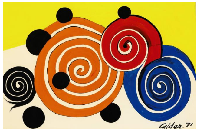
《四個螺旋與六個點》 1971 年 水粉、墨紙本 74.9 x 109.9 公分