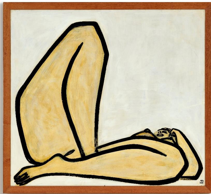
常玉《曲腿裸女》，油彩纤维板，1965 年作，122.5 x 135 公分