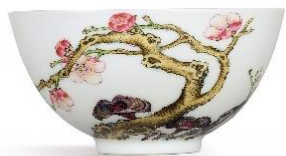
清雍正 粉彩春梅灵芝碗 《大清雍正年制》款 10.1 公分 估价：12,000,000 至 15,000,000 港元