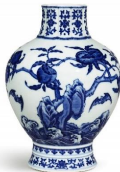
清乾隆 青花五蝠九桃花口瓶 《大清乾隆年制》款 25.3 公分 估价：6,000,000 至 8,000,000 港元