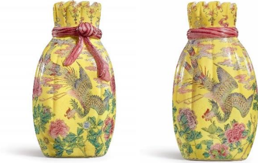
清乾隆 料胎黄地画珐琅凤舞牡丹包袱瓶 《乾隆年制》蓝料款 18.2 公分 估价待询（预料成交价逾 2 亿港元）