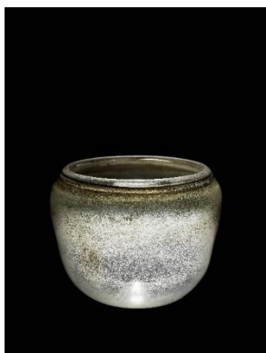
唐 琉璃宝钵 31 公分 估价：4,000,000 至 6,000,000 港元