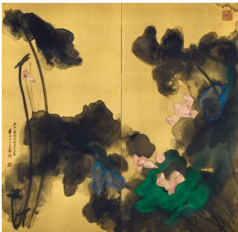
张大千《花开十丈影参差》，泼墨泼彩金笺，双折屏风，1973 年作，178 x 180 公分

公开展览：2019 年 10 月 12 日至 11 月 9 日（逢周一至周六） 蘇富比艺术空间 | 金钟太古广场一期五楼