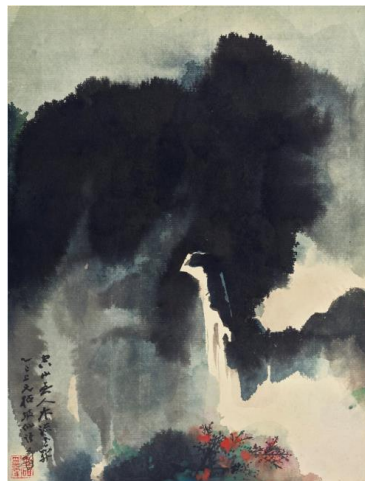
《空山水流花开》 泼墨泼彩纸卡 镜框，1965年作 53 x 41 公分