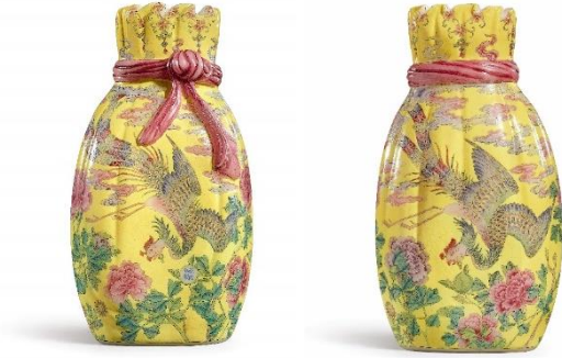
清乾隆 料胎黃地畫琺瑯鳳舞牡丹包袱瓶 《乾隆年製》藍料款 18.2 公分 估價待詢（預料成交價逾 2 億港元）