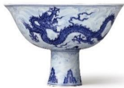
明宣德 青花海水雲龍紋高足盃 《大明宣德年製》款 徑 15.6 公分 估價待詢（預料成交價逾 60,000,000 港元）

此高足盃上繪湛藍游龍，盡顯天威，隙地以淡青畫水波激灑，剛柔並濟，充分展現宣德年間景德鎮御窯瓷匠的絕藝巧工，心手相應，空前絕後。