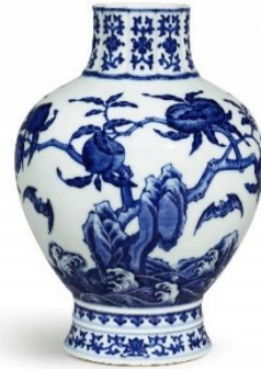
清乾隆 青花五蝠九桃花口瓶 《大清乾隆年製》款 25.3 公分 估價：6,000,000 至 8,000,000 港元