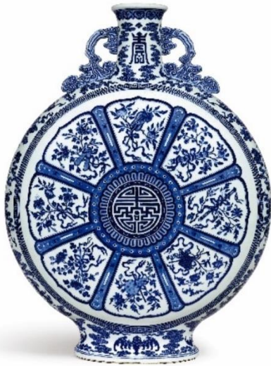
清乾隆 青花蓮瓣式開光暗八仙雙耳扁壺 《大清乾隆年製》款 50.5 公分 估價待詢（預料成交價逾 40,000,000 港元）

此私人收藏專場誠獻清代御瓷二十二件，展示藏家之超卓品味、獨具慧眼。收藏尤以雍正單色釉瓷為精，器形多樣、釉色不一。精品且有乾隆青花暗八仙雙耳扁壺，華美珍罕，以及乾隆仿汝釉葵式雙龍耳瓶，器形清麗雅緻。