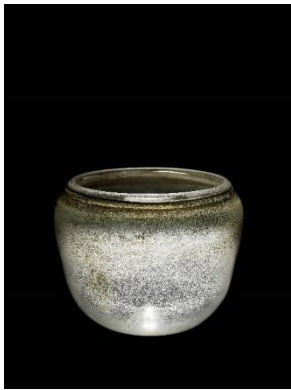
唐 琉璃寶鉢 31 公分 估價：4,000,000 至 6,000,000 港元