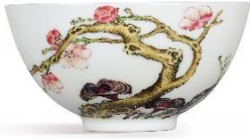
清雍正 粉彩春梅靈芝盃 《大清雍正年製》款 10.1 公分 估價：12,000,000 至 15,000,000 港元