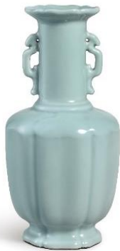
清乾隆 仿汝釉葵式雙龍耳盤口瓶 《大清乾隆年製》款 19.9 公分 估價：3,000,000 至 5,000,000 港元