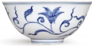
明成化 青花萱草紋宮盃