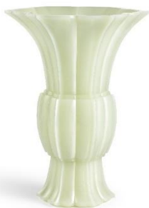
清乾隆 白玉菱花式花觚

利國偉爵士（1918-2013 年）蒐珍集寶，所藏中國藝術品古雅精罕，不少乃七、八十年代購自倫敦及香港蘇富比。今秋承去年十月佳績，續呈華瓷美玉逾四十件，包括明永樂月季花盃，雅緻可人，以及清中期白玉菱花式花觚，玉質勻淨透亮，線條流麗大方。