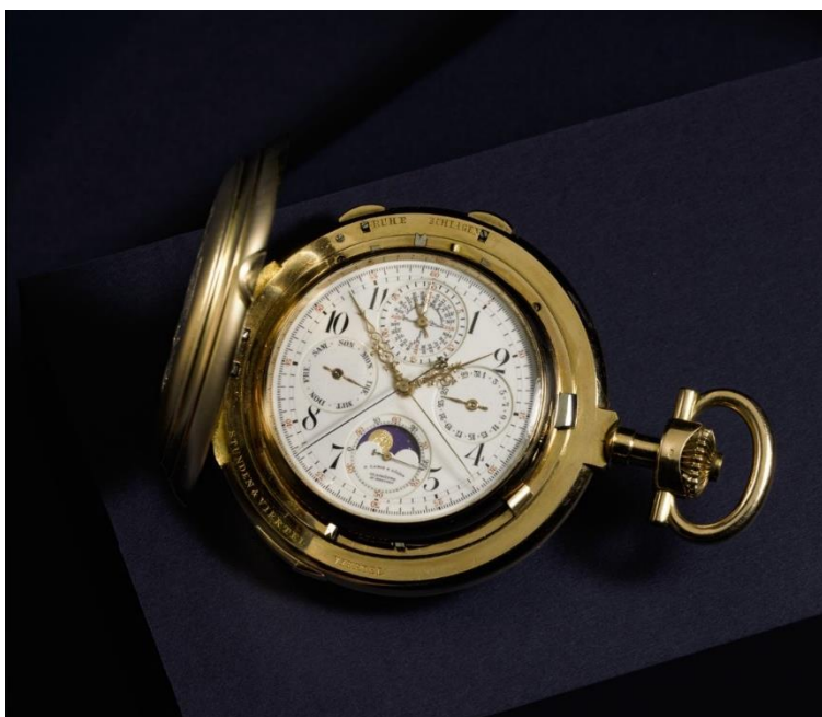
A. Lange & Söhne: montre de poche en or rose avec calendrier perpétuel, répétition des minutes, phases de la lune et chronographe à rattrapante, 1901 Estimation : 400 000 – 600 000 CHF / 403 000 – 605 000 USD

Genève, le 15 octobre 2019 – Suite aux nombreux records atteints cet été à Londres par les premières ventes dédiées à la collection « Masterworks of Time », une nouvelle sélection de montres issue de cette collection exceptionnelle sera proposée chez Sotheby's à Genève le 11 novembre 2019 . Considérée comme l'une des plus importantes collections horlogères en mains privées, cet ensemble de 800 garde-temps, dont la qualité et l'envergure restent inégalées, illustre cinq siècles d'histoire horlogère de la Renaissance au XXème siècle.