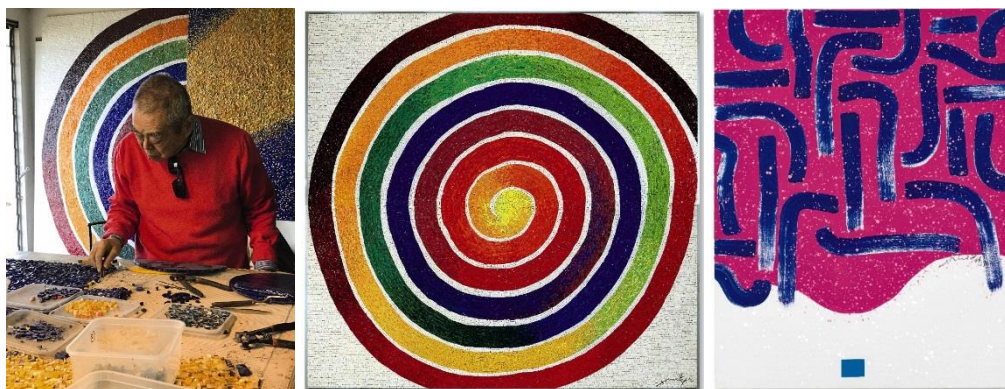
（左起）：2017年11月，蕭勤於萊杜斯（Lino Reduzzi）位於意大利米蘭的工作室創作一系列馬賽克作品（圖片來源／蕭勤及3812畫廊）； 《宇宙大旋渦》，1983至2014年作；《光之躍動—5》，1963年作

「蕭勤：無限宇宙」展售會得到藝術家、蕭勤國際文化藝術基金會、藝術家的代理畫廊及收藏家的全力支持，展出亞洲現代藝術先鋒蕭勤從六十年代至近年逾26幅作品，並首次完整展出其珍稀的馬賽克系列，為香港歷來最大規模的蕭勤作品展售會。