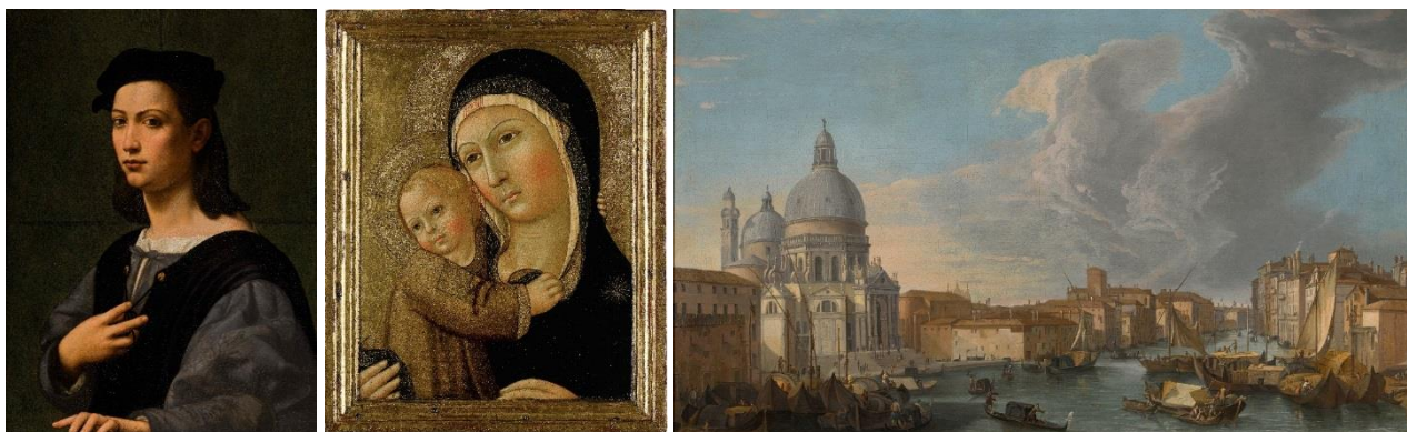
(左起)：朱利亞諾·迪·彼羅·迪·西莫內·布賈爾迪尼《年輕男子肖像》；薩諾·迪·彼得羅《聖母與聖嬰》；盧卡·卡萊瓦里斯《威尼斯，大運河與安康聖母聖殿景觀》

去年香港蘇富比首場西洋古典藝術展售會「遇見自然 / 西洋古典選粹」大獲好評。承此佳績，蘇富比將在10月於香港再度呈獻第二季古典藝術展售會——「遇見意大利」。