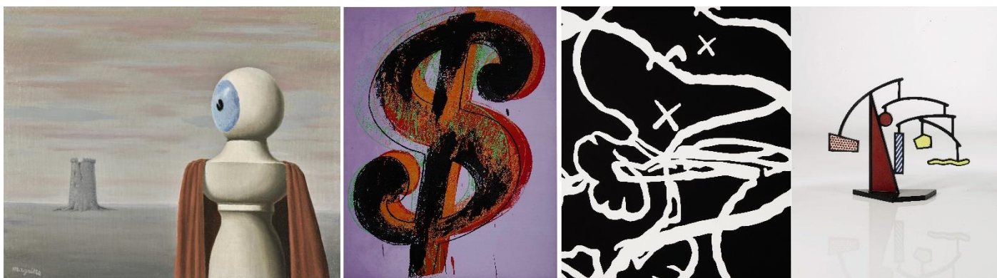
(左起)：雷內·馬格利特《多年以前》，1965年作；安迪·荷《美元符號》，1981年作；KAWS《無題 (MBFT5)》，2015年作；羅伊·李奇登斯坦《動態I》，1989年作