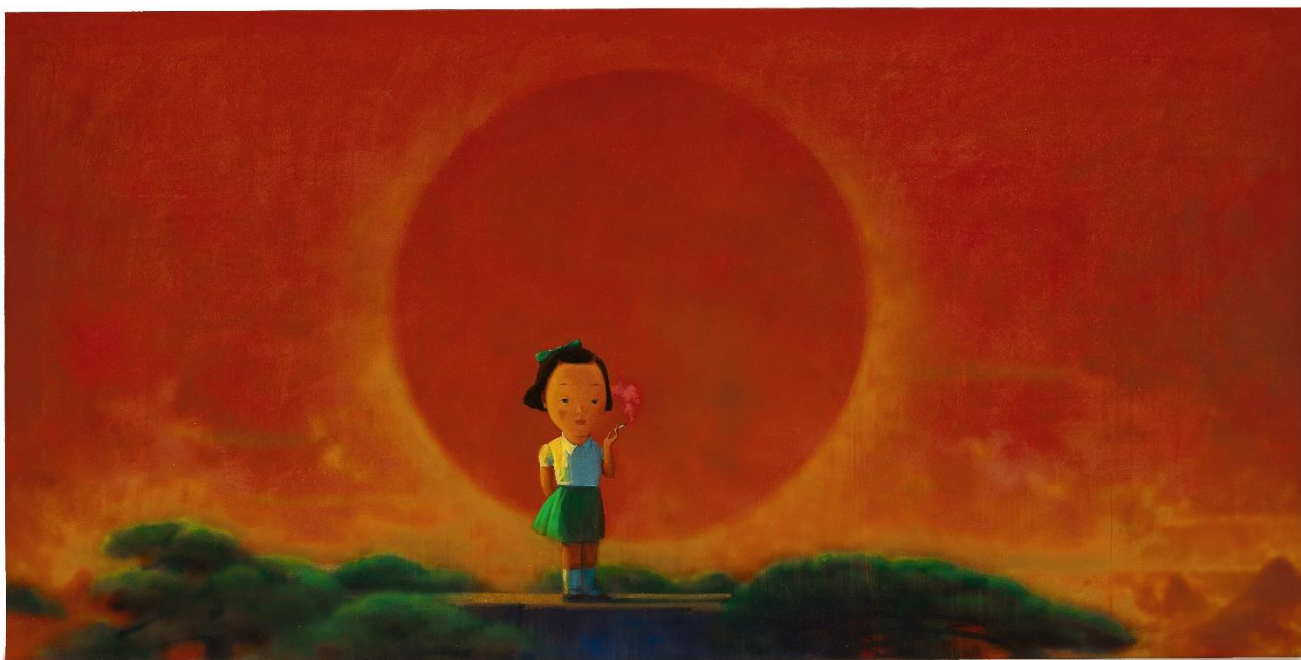
刘野《烟》，2001至2002年作，178 x 365.5 公分

由吉利翁·库维男爵夫人（ Baroness Gillion Crowet ）建立之显赫收藏 汇集中国当代艺术家杰作